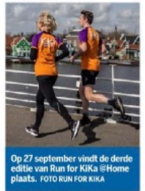
Op 27 september vindt de derde editie van Run for KiKa @Home plaats.

Meer informatie en aanmelden via www.runforkiika.nl/at-home .