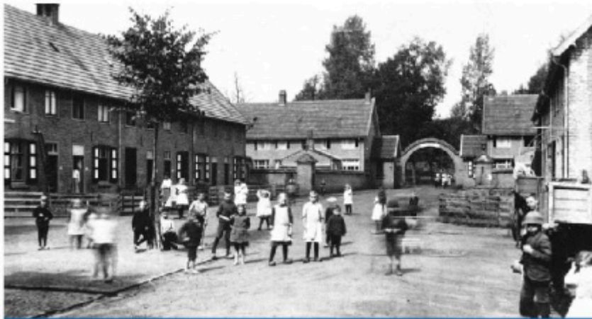
Pastoor Roselaersplein in De Slak.